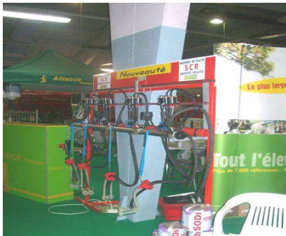
Des expositions de matériel