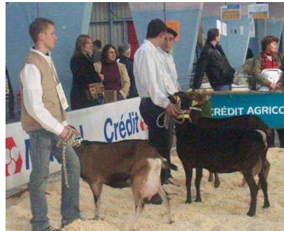
Des concours caprins