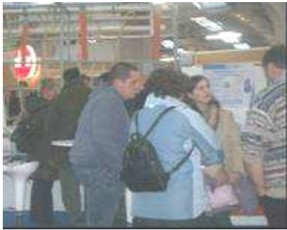
Des rencontres entre éleveurs