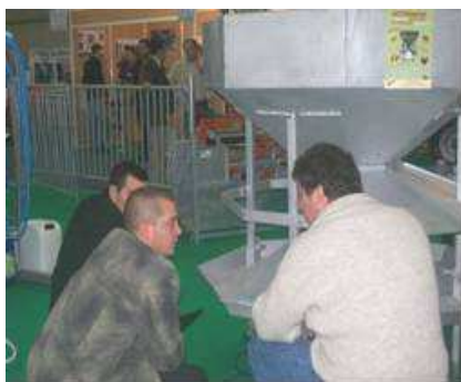
Des échanges riches entre éleveurs et techniciens