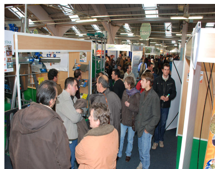
3000 visiteurs au parc des expositions pour capr'innov